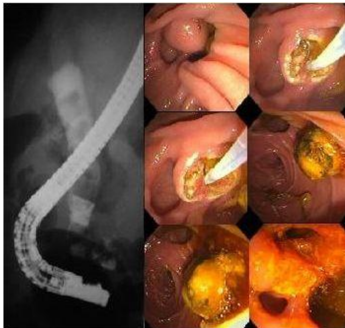
Extracción de cálculos de los conductos biliares mediante CPRE

Esta situación no es frecuente pero puede ocurrir, sobre todo si no había síntomas, estudios preoperatorios o hallazgos quirúrgicos que sugirieran esta situación. Muy pocos pacientes requerirán una segunda cirugía ya que habitualmente el problema se resuelve sin cirugía con un estudio llamado Colangio-Pancreatografía-Retrógrada-Endoscópica (CPRE). Si desea saber en que consiste este estudio, consulte la sección de Estudios de Laboratorio y Gabinete .