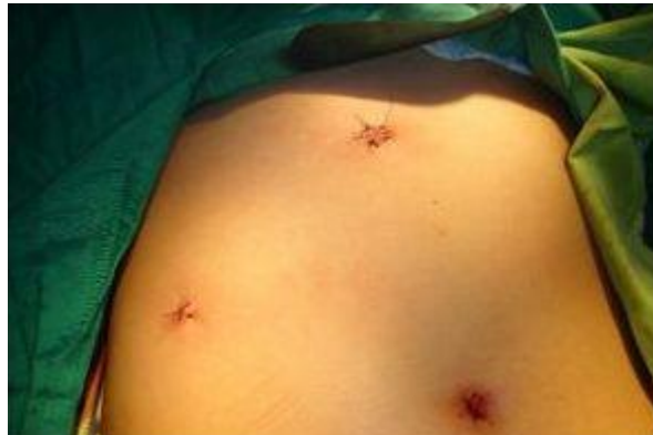
Cicatrices que deja la cirugía de la vesícula por vía laparoscópica

De acuerdo al caso, el paciente puede irse a su casa el mismo día o permanecer uno o dos días hospitalizado. La cirugía laparoscópica permite una rápida recuperación (10 días) y un aspecto estético muy bueno. La cirugía convencional requiere de más tiempo de recuperación. Una vez que el paciente se haya recuperado, podrá volver a comer los alimentos que antes le ocasionaban el dolor y tener una vida completamente normal.