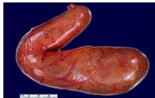
Vesícula biliar inflamada