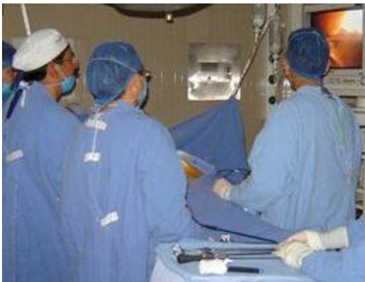
Cirugía Laparoscópica de la vesícula biliar (Colecistectomía)

Para curar esta enfermedad es necesario quitar la vesícula mediante cirugía. Lo ideal es que sea una cirugía programada y en un momento en que no haya dolor; sin embargo, a veces es necesario realizar una cirugía de urgencia. En la actualidad existen dos métodos para hacerlo: con cirugía tradicional (con cortada en el abdomen) y con cirugía laparoscópica (usando cámaras y pinzas que se introducen en el abdomen a través de cortadas muy pequeñas). Su médico le podrá explicar a más detalle en qué consisten estos procedimientos, cual es el más adecuado de acuerdo a su caso y si se requiere realizar algún procedimiento adicional.