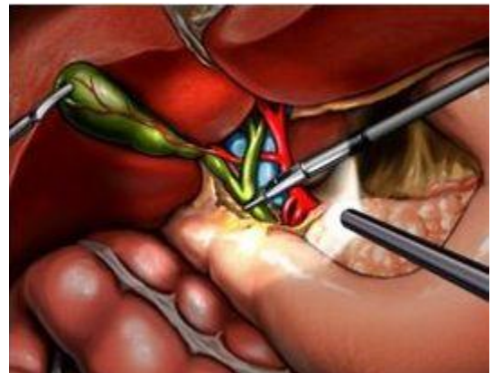
Esquema de la colecistectomía laparoscópica