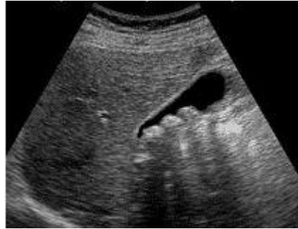
Ultrasonido de la vesícula biliar donde se observan piedras en su interior

Es indispensable realizar un ultrasonido de hígado y vías biliares para el diagnóstico. En este estudio se puede observar si la vesícula está inflamada y si tiene piedras. También puede ayudar a sospechar si hay piedras que se salieron de la vesícula y se quedaron atorados en los conductos de las vías biliares (coledocolitiasis).