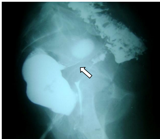
Colon por enema: Se observan divertículos y la comunicación entre el colon y la vagina (flecha).

Se requiere una exploración cuidadosa por ano y vagina. Si el orificio no se identifica fácilmente es necesario solicitar una rectosigmoidoscopia flexible, un colon por enema y, quizá, otros estudios para evaluar los músculos que permiten la función del ano. En casos asociados a cáncer, se debe realizar una biopsia de la fístula para descartar que no haya cáncer. Si desea saber en qué consisten esos estudios, consulte la sección de Estudios de Laboratorio y Gabinete .