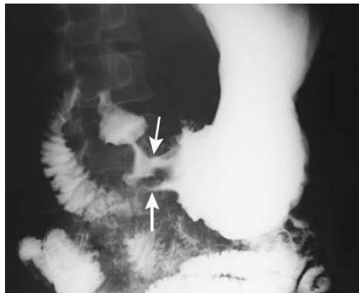
Estenosis del estómago ocasionado por úlcera

Ocurre con úlceras de mucho tiempo en los que hay múltiples episodios de inflamación que, al paso del tiempo, producen cicatrices dentro del estómago o intestino delgado que finalmente los dejan muy estrechos, impidiendo el paso adecuado de los alimentos. Esta complicación requiere de cirugía para resolverla. Su médico le explicará el tipo exacto de cirugía que usted requiera de acuerdo a su caso.