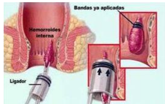
Ligadura con bandas elásticas

Consiste en colocar una o varias ligas pequeñas en la base de la hemorroide enferma, provocando que dicha hemorroide se caiga sola en una semana. Es un procedimiento que se realiza en el consultorio, no requiere de anestesia, las molestias que ocasiona son mínimas y el paciente puede ir a su casa al término del procedimiento. El paciente se puede incorporar a sus actividades inmediatamente y sólo requiere seguir una dieta sencilla. A nivel internacional, es el procedimiento de elección para el tratamiento de los casos más leves de enfermedad hemorroidal interna.