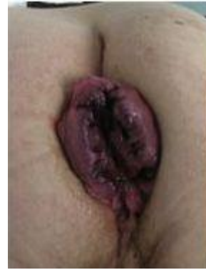
Caso severo de hemorroides