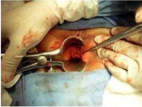
Cirugía tradicional de hemorroides

Consiste en retirar las hemorroides internas y externas que estén enfermas. Se puede emplear en todos los tipos de enfermedad hemorroidal y actualmente es el procedimiento de elección para los casos más severos.