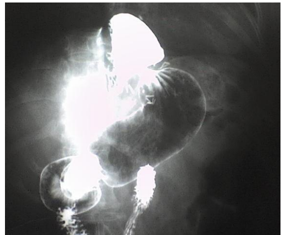
Serie esófago-gastro-duodenal donde se observa una hernia hiatal grande.

Aunque una panendoscopia puede dar el diagnóstico, se requiere de una serie esófago-gastro-duodenal para determinar qué tipo de hernia hiatal es. Si desea saber en qué consisten éstos estudios, consulte la sección de Estudios de Laboratorio y Gabinete .