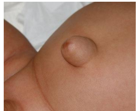
Hernia umbilical en un lactante.

Si la hernia no es muy grande, los niños pueden permanecer en observación hasta los 5 años de edad, ya que muchos casos se curan solos. Si la hernia sigue estando después de los 5 años, es necesario realizar una cirugía para regresar todos los órganos a su lugar y cerrar el orificio de la hernia.