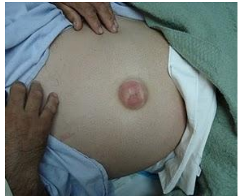
Paciente con hernia umbilical complicada. La piel está de color rojo por la infección.

Cuando el contenido de la hernia se queda atorado hay dolor intenso e infección; ésta situación es una urgencia y requiere cirugía para resolverla.