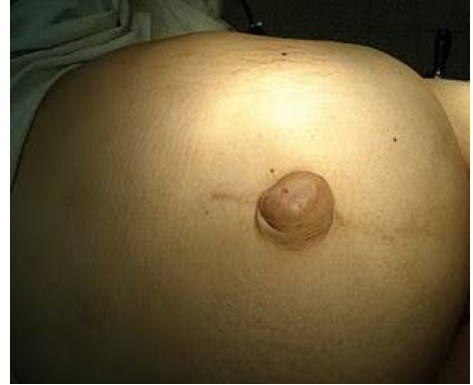
Paciente con hernia umbilical.

La hernia umbilical produce un ombligo “salido” o “saltón”; en algunas personas aparece con los esfuerzos y desaparece con el reposo o al empujarla con los dedos; en otros casos nunca se regresa. Con el tiempo, la hernia se hace más y más grande. Muchos pacientes sufren dolor y otros no.